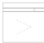
A 31 - DIN Links